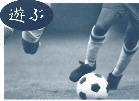
母畑レークサイドセンター

阿武隈地域の豊かな緑と清らかな水の流れなどの美しい自然に包まれ、長い歴史と伝統を伝承しながら石川町には、訪れる人を飽きさせない魅力があります。